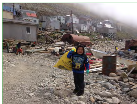
Уборка отходов на острове Крузенштерна (Аляска). На острове Крузенштерна успешно осуществляется уборка побережья и отходов благодаря активному участию местного населения и хорошему планированию, а также благодаря помощи туристов.