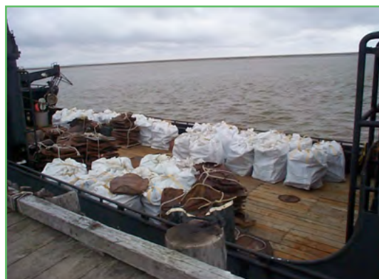
Отходы, собранные и вывезенные на барже из Нулато (2015)