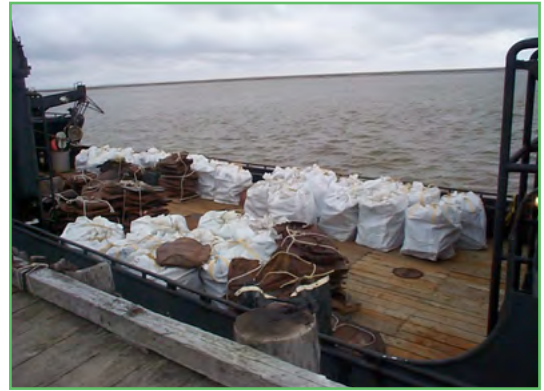
Bázahusat čoggon ja fatnasiiguin fievrriduvvon Nulatos, Alaskas (2015)