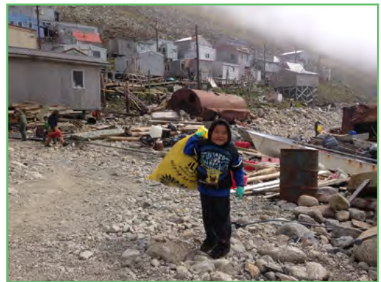
Bázahusčorgen Little Diomedes, Alaskas. Little Diomede lea leamaš lihkestuvvan riddu- ja bázahusčorgenrahčamuš doaimmalaš servodatberošteami ja plánema bokte, ja vel veahkki turisttain mat leat guossin.