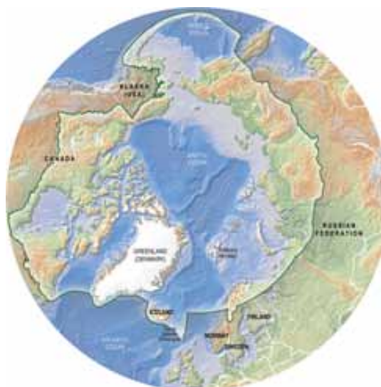
Район деятельности Рабочей группы по сохранению арктической флоры и фауны

Редакторы Майкл Гилл и Том Бэрри Художественное оформление Тома Бэрри